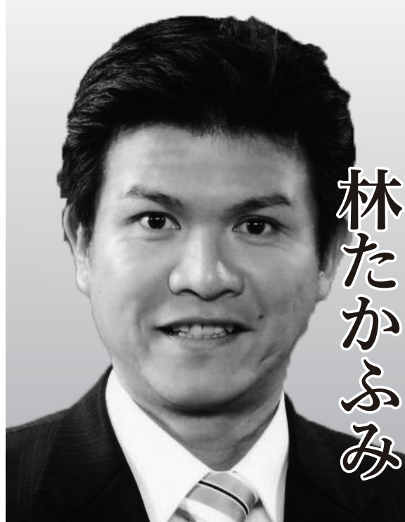
八千代市議会議員